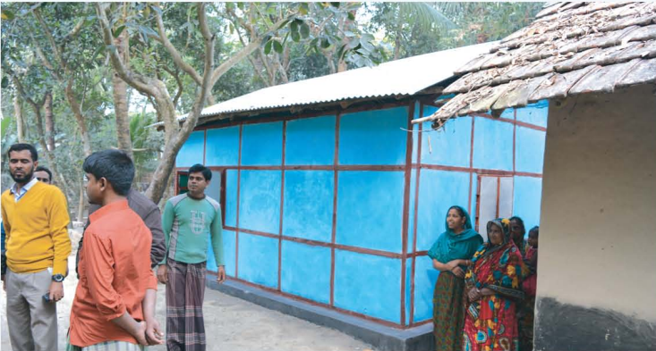
অতিদরিদ্র সদস্যদের এদস্ত বিশেষ প্রযুক্তির ঘর

বিগত মার্চ ২০১৬-জুন ১৭ সময়কালে সাতক্ষীরা জেলার সদর এবং কালিগঞ্জ উপজেলায় ও বাগেরহাট জেলার রামপাল উপজেলায় ৫৫ টি অতি দরিদ্র পরিবারকে নতুন ঘর তৈরি করে দেওয়া হয়েছে। রুরাল রিকনস্ট্রাকশন ফাউন্ডেশন উপকূলীয় অঞ্চলে হ্যাবিটেট ফর হিউম্যানিটি ইন্টারন্যাশনাল বাংলাদেশ এর সহযোগীতায় "Improving water, sanitation, hygiene and housing situation of vulnerable Rishi communities", "Building disaster resilient communities through participatory approach for safe shelter awareness (PASSA) and improving access to WASH facilities" Ges "Improving the lives of seafarer by building a more disaster resilient community" তিনটি প্রকল্প বাস্তবায়ন করছে। দেশের উপকূলীয় অঞ্চলে পিছিয়ে পড়া অতি দরিদ্র জনগোষ্ঠির গৃহায়নের চাহিদা পূরণের মাধ্যমে তাদের নিরাপদ আশ্রয়, নিরাপদ পানি ও স্বাস্থ্যসম্মত পয়ঃনিষ্কাশনের সুব্যবস্থা প্রদানের মাধ্যমে তাদের দৈনন্দিন জীবনযাত্রার মান উন্নয়ন করা। প্রকল্পে নিরাপদ পানির ব্যবহার, পরিষ্কার পরিচ্ছন্নতা ও স্বাস্থ্য সম্পর্কিত সেমিনার ও ওয়ার্কশপ আয়োজন করে জনগোষ্ঠির মধ্যে স্বাস্থ্য ও দূর্বোগ ব্যবস্থাপনা সম্পর্কিত সচেতনতা বৃদ্ধি করেছে। এ সময়কালের মধ্যে নতুন ঘর ছাড়াও ৫৫টি পরিবারের ঘরের চালা মেরামত এবং ২৩৪ টি পরিবারে নতুন স্বাস্থ্যসম্মত পায়খানা ৬০ টি পরিবারে লবনাক্ত পানি বিশুদ্ধ মিষ্টি পানিতে পরিণত করার সোলার সিস্টেম, ৩০ টি জেলে পরিবারে গভীর সমুদ্রে ব্যবহার উপযোগী ৩০ টি মোবাইল ও লাইফ জ্যাকেট প্রদান করে তাদের ন্যূনতম মৌলিক চাহিদা পূরণ করা হয়েছে।