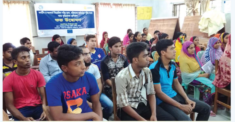
কার্যক্রমের উদ্বোধন অনুষ্ঠানে বি-স্কিলফুল কার্যক্রমের অংশগ্রহণকারীগণ।

আরআরএফ সুইস কন্টাক্ট ও ইউরোপিয়ান ইউনিয়ন এর আর্থিক সহযোগীতায় যশোর জেলায় বিগত ০১ মে, ২০১৭ তারিখ থেকে বি-স্কিলফুল কার্যক্রম বাস্তবায়ন করছে। এই কার্যক্রমের লক্ষ্য হলো দরিদ্র ও সুবিধাবঞ্চিত নারী ও পুরুষের জীবনযাত্রার মান উন্নয়নের লক্ষ্যে, শ্রমবাজারে প্রবেশের সুযোগ সৃষ্টি ও আয় বৃদ্ধি করা। এই প্রকল্পের মাধ্যমে দক্ষতা উন্নয়নের পাশাপাশি ব্যবসায়িক উদ্যোগ গ্রহণের বিষয়েও কার্যকরী পদক্ষেপ নেয়। আরআরএফ ইতোমধ্যে ১২০ জনকে টেইলরিং, বিউটিফিকেশন, মোবাইল ফোন টেকনিশিয়ান, জুট ব্যাগ, কনজুমার ইলেক্ট্রনিক্স, ইলেক্ট্রিক্যাল হাউজ ওয়্যারিং এর উপর বিভিন্ন মেয়াদের কারিগরি প্রশিক্ষণ প্রদান করা হয়েছে।