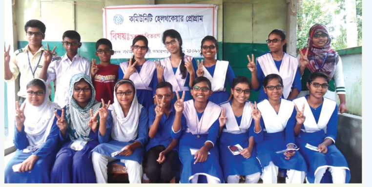
ঝিকরগাছা উপজেলার বিভিন্ন স্কুলের শিক্ষার্থীদের চশমা প্রাপ্তি

সাইটসেভার্স এর সাথে পার্টনারশীপের ভিত্তিতে যশোর জেলার ঝিকরগাছা উপজেলার গদখালী ও শিমুলিয়া ইউনিয়নে অবস্থিত বিভিন্ন স্কুলের ২১ জন শিক্ষার্থীকে চক্ষু বিষয়ক বিভিন্ন চিকিৎসা উত্তর চশমা প্রদান করা হয়েছে। বহুরের শুরুতে অত্র এলাকার বিভিন্ন স্কুলের সকল শিক্ষার্থীদের চক্ষু পরীক্ষা করা হয়। সাইটসেভার্স এর সহায়তায় সংস্থার কমিউনিটি হেলথকেয়ার কার্যক্রমের প্যারামেডিকগণ স্ক্রিনিং এর মাধ্যমে ১৭০০ শিক্ষার্থীর মধ্যে ৩০০ জনকে চোখের দৃষ্টি সমস্যা চিহ্নিত করেন। পরবর্তীতে সাইটসেভার্স এর নিজস্ব রিফেকশনিস্ট দ্বারা ২১ জনের চূড়ান্ত চোখের দৃষ্টি সমস্যা চিহ্নিত করা হয়। গত সেপ্টেম্বর ২০১৭ মাসে চিহ্নিত ২১ জন শিক্ষার্থীকে চশমা প্রদান করা হয় যারা বেনেয়ালী হাই স্কুল, কামারপাড়া সরকারী প্রাথমিক বিদ্যালয়, বর্ণমালা বিদ্যাপীঠ কামারপাড়া, সেন্ট লুইস হাই স্কুলে বর্তমানে অধ্যয়নরত রয়েছে। এখানে উল্লেখ্য আরআরএফ সংস্থার কর্মএলাকায় কমিউনিটি হেলথকেয়ার কার্যক্রমের মাধ্যমে তৃণমূল পর্যায়ে বিভিন্ন ধরনের স্বাস্থ্যসেবা প্রদান করে আসছে।