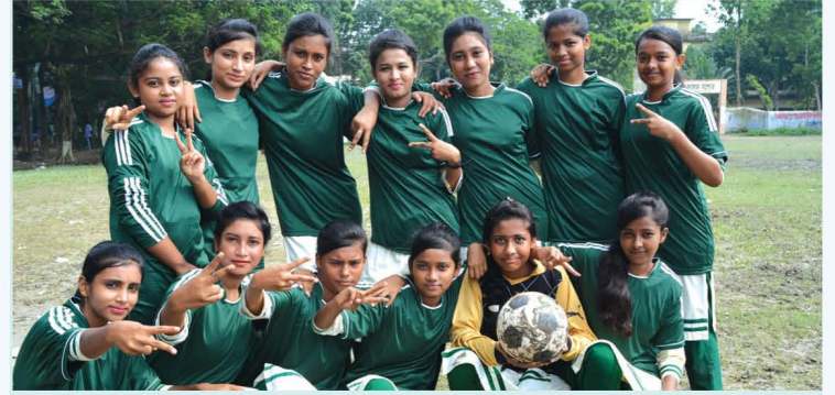
আরআরএফ পরিচালিত বর্ণমালা বিদ্যাপীঠ যশোর স্কুলের বালিকা ফুটবল দল

গত আগস্ট ২০১৭ মাসে যশোর সদর উপজেলা মাধ্যমিক শিক্ষা অফিস আয়োজিত আন্তঃস্কুল বালিকা ফুটবল প্রতিযোগিতায় আরআরএফ পরিচালিত বর্ণমালা বিদ্যাপীঠ যশোর স্কুল অংশগ্রহন করে সেমিফাইনালে খেলার যোগ্যতা অর্জন করে। লেখাপাড়ার পাশাপাশি শিক্ষার্থীদের শারীরিক ও মননের বিকাশের জন্য সংস্থা পরিচালিত স্কুলগুলো নানান সাংস্কৃতিক ও ক্রীড়া তথা বিভিন্ন সহ-পাঠক্রমিক কাজে নিয়মিতভাবে অংশগ্রহন করে থাকে। এখানে উল্লেখ্য আরআরএফ এর নিজস্ব অর্থায়নে যশোর, মেহেরপুর ও বিনাইদাহ জেলায় মোট ৭টি স্কুলের মাধ্যমে আনুষ্ঠানিক শিক্ষা কার্যক্রম পরিচালিত হচ্ছে। স্কুলগুলোতে প্লে গ্রুপ থেকে দশম শ্রেণি পর্যন্ত পাঠদান করা হয়। শিক্ষা মন্ত্রণালয় ও যশোর শিক্ষা বোর্ডের রেজিস্ট্রেশন নিয়ে স্কুল গুলো শিখন শেখানো কার্যক্রম পরিচালনা করছে।