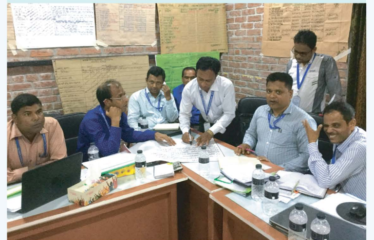
ঋণ কার্যক্রমের কর্মকর্তাবৃন্দ আরআরএফ প্রশিক্ষণ কেন্দ্রে প্রশিক্ষণ গ্রহণ করছেন।

সংস্থার স্টাফ ডেভেলপমেন্ট ও প্রশিক্ষণ বিভাগ বিগত জুলাই থেকে সেপ্টেম্বর, ২০১৭ সময়কালে সংস্থার চলমান বিভিন্ন কার্যক্রমে কর্মরত ২২৪ জন কর্মকর্তাকে বিভিন্ন বিষয়ের উপর প্রশিক্ষণ প্রদান করেছে। সংস্থার মাইক্রোফাইন্যান্স কার্যক্রমের ৬১ জন সিনিয়র ক্রেডিট অফিসার কে ঋণ কার্যক্রম বিষয়ক মৌলিক প্রশিক্ষণ, ২৪ জন শাখা হিসাবরক্ষককে হিসাব ও অর্থ ব্যবস্থাপনা বিষয়ক মৌলিক প্রশিক্ষণ, ৬৯ জন জুনিয়র ক্রেডিট অফিসার কে ঋণ কার্যক্রম বিষয়ক মৌলিক প্রশিক্ষণ, ৪২ জন সিনিয়র ক্রেডিট অফিসার ও হিসাবরক্ষককে মানোন্নয়ন প্রশিক্ষণ প্রদান করা হয়েছে। মূলত সংস্থার কার্যক্রমকে সম্প্রসারণ, কার্যক্রমের গুণগত মান নিশ্চিতকরণ ও স্টাফদের দক্ষতা বৃদ্ধি করার লক্ষ্যে বিভিন্ন মেয়াদের প্রশিক্ষণ চাহিদার ভিত্তিতে নির্দিষ্ট মডিউল অনুযায়ী প্রশিক্ষণ প্রদান করা হয়।