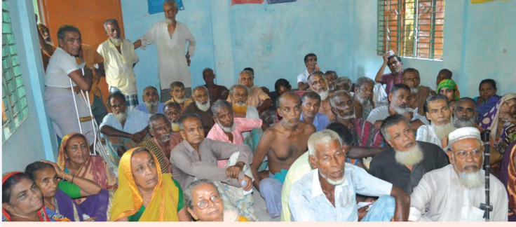
পাইকগাছা উপজেলার গদাইপুর ইউনিয়নের তালিকাভুক্ত প্রবীণ নারী ও পুরুষগণ

খুলনা জেলার পাইকগাছা উপজেলার গদাইপুর ইউনিয়নের সবকটি গ্রামের ৬০ উর্ধ্ব নারী-পুরুষ তথা প্রবীণ জনগোষ্ঠীকে নিয়ে পল্লী কর্ম-সহায়ক ফাউন্ডেশন (পিকেএসএফ) এর সহযোগীতায় “প্রবীণ জনগোষ্ঠীর জীবনমান উন্নয়ন” কর্মসূচি বিগত জুলাই-২০১৭ মাস থেকে শুরু হয়েছে। রুরাল রিকনস্ট্রাকশন ফাউন্ডেশন এই কার্যক্রমকে বাস্তবায়ন করার জন্য ইউনিয়নব্যাপী জরিপ কার্যক্রম সম্পন্ন করে ৭৩৯ জন প্রবীণ মানুষকে তালিকাভুক্ত করেছে। এই জনগোষ্ঠীর মানবিক মর্যাদা তথা তাদের অবদানের স্বীকৃতিস্বরূপ নানাবিধ কর্মকান্ড ও সহযোগীতা প্রদান করা হবে। বয়স্ক মানুষদের জন্য স্থানীয়ভাবে একটি বিনোদন কেন্দ্র যেখানে নানাবিধ খেলাধুলা ও স্বাস্থ্য বিষয়ক উপকরণ নিশ্চিত করা হবে। পাশাপাশি তাদের বয়স্ক ভাতা, স্বাস্থ্যসেবা, ফিজিও থেরাপী, ছাতা ও কমল বিতরণসহ নানাবিধ সেবা প্রদান করা হবে।